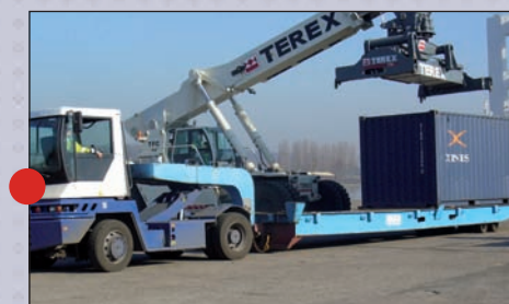
● Applications portuaires Port applications