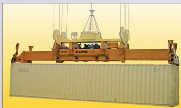
SPREADERS ELME / ELME SPREADERS

ELME is one of the leading manufacturers of all kinds of spreaders for cranes, RTG, forklifts and reachstackers and is renowned for its quality worldwide. FRANCETRUCK is the official distributor for ELME in France since 2006.