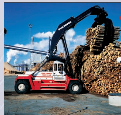
● Manutention bois Wood handling