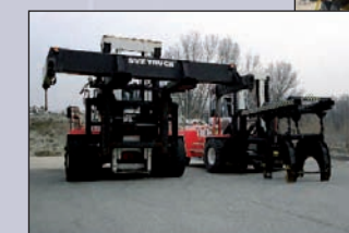
● Industrie nucléaire - AREVA, site du Tricastin Nuclear industry - AREVA, Tricastin site