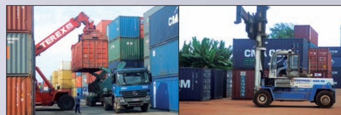
● Matériel en Afrique Machines in Africa