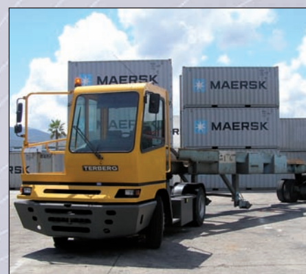
● Plateformes industrielles-logistiques Logistic distribution yards